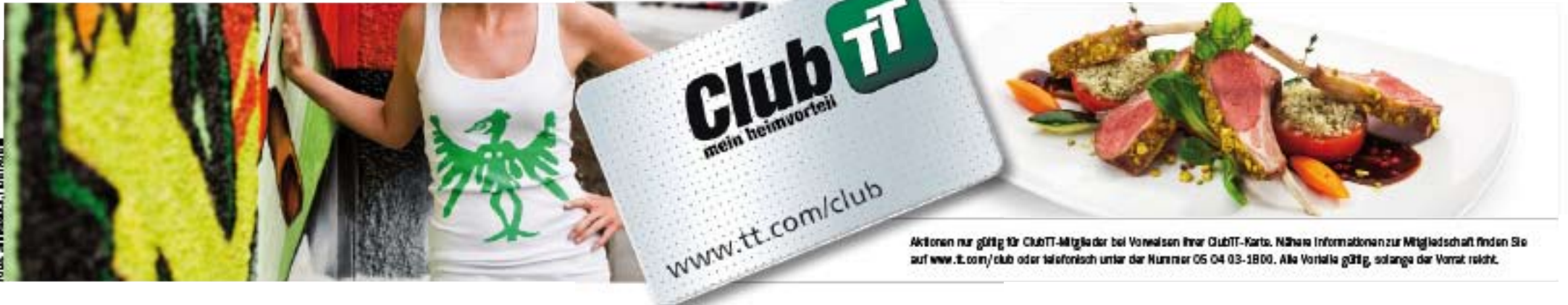
Aktionen nur gültig für ClubTT-Mitglieder bei Vorweisen Ihrer ClubTT-Karte. Nähere Informationen zur Mitgliedschaft finden Sie auf www.tt.com/club oder telefonisch unter der Nummer 05 04 03-1800. Alle Vorteile gültig, solange der Vorrat reicht.