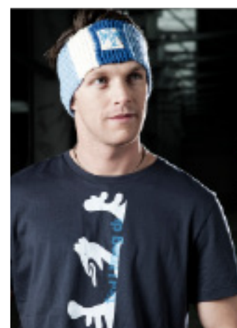
Die Tiroler Adlerin hat einen hohen Anspruch an Qualität und Liebe zum Detail.

Tirol – Die Tiroler Adlerin verbindet die weibliche Leidenschaft für das Schöne, für Mode, Kunst und Style mit der Liebe zu Tradition und Handwerk. Seit nunmehr zwei Jahren ist die Tiroler Adlerin aus der heimischen Modeszene nicht mehr wegzudenken. Inspiriert durch die Liebe zur Heimat steht diese Mode für eine einzigartige Verbindung von Moderne und Tradition. Die edlen, individuellen und oft etwas ausgefallenen handgemachten Einzelstücke sind ebenso wie die eher sportliche Streetwear immer ein absoluter Hingucker. Die Textilien sind so hochwertig wie auch heimatverbunden, verziert mit dem Ornament weiblicher Individualität. ClubTT-Mitglieder haben nun die einzigartige Möglichkeit, eine Ermäßigung von 20 Prozent auf die Produkte der Tiroler Adlerin zu erhalten. Wie's geht, steht im Infokasten rechts!