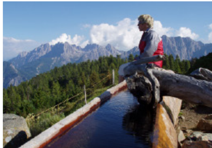
Mit den Lienzer Bergbahnen die Berge erkunden - das geht ruckzuck mit den vergünstigten Tickets vom ClubTT.