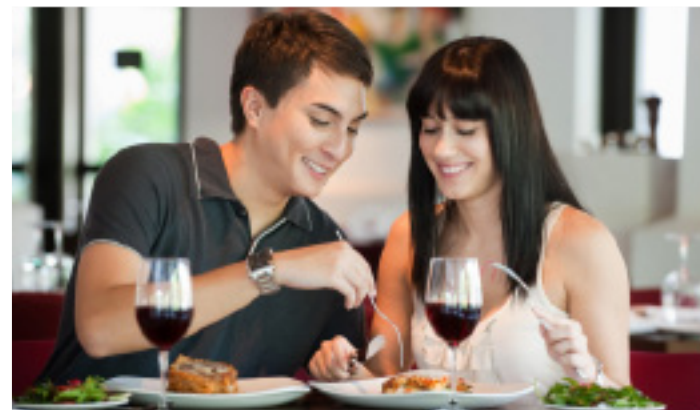
Gemeinsam die Köstlichkeiten der Tiroler Küche erleben - mit den ClubTT-Gutscheinen macht das gleich noch mehr Spaß.

Alle Details zum Einlösen finden Interessierte im Infokasten rechts sowie im Gutscheineheft, welches heute der TT exklusiv für ClubTT-Mitglieder beigelegt ist.